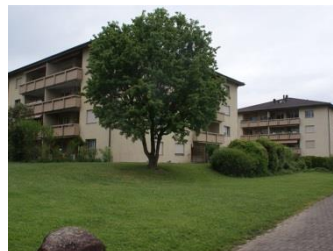
Dezentrales Wohnen Rütliweg