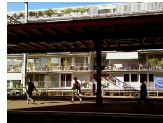
Dezentrales Wohnen Industriestrasse