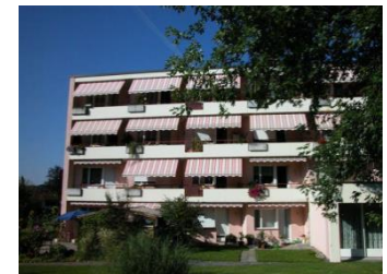
Dezentrales Wohnen Rehbühl