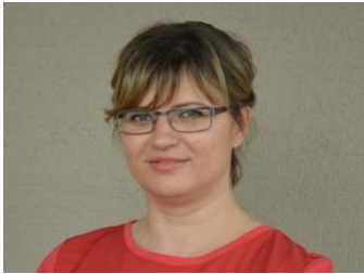
Radojka Rennpferd Kunstvoll