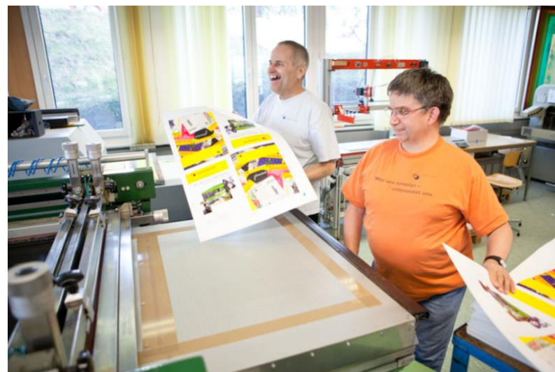
Mitarbeiter in der Druckerei