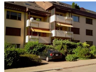
Dezentrales Wohnen Bertastrasse