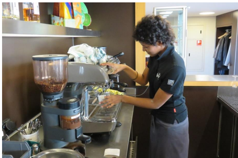
Mitarbeiterin im 8610 Restaurant