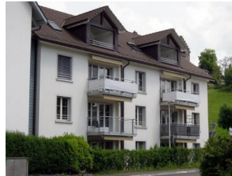
Zentrales Wohnen Talacker