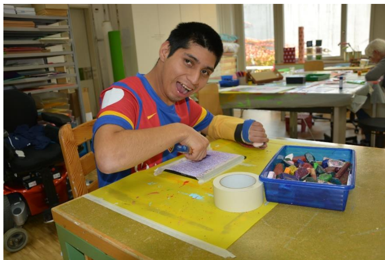
Klient bei der Arbeit in der Tagesstätte