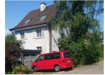
Dezentrales Wohnen Rothstrasse