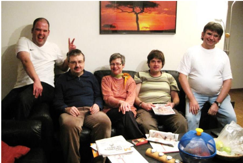
Gemeinsamer Abend in der Wohngruppe am Rütliweg