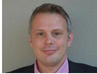
Florian Rennpferd Dezentrales Wohnen