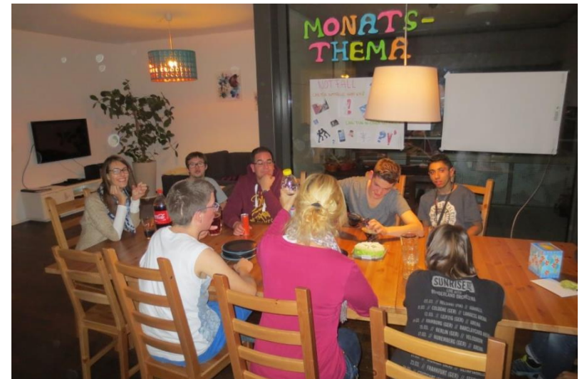
Znacht auf der Wohngruppe für junge Erwachsene