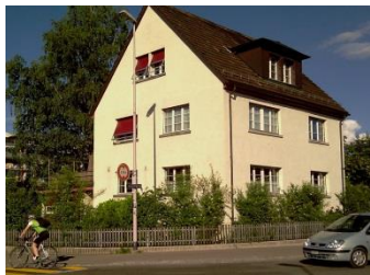
Dezentrales Wohnen Bankstrasse