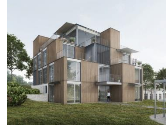
Zentrales Wohnen Friedhofstrasse 5