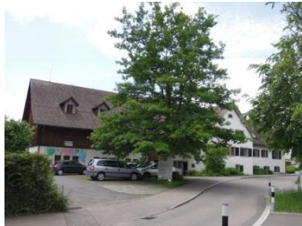
Heussergut & Trotte