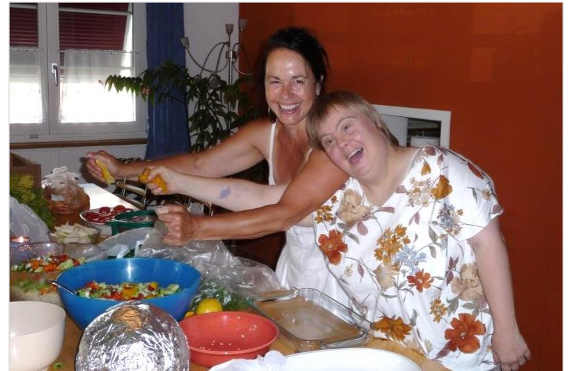
Kochen in der Wohngruppe an der Bankstrasse