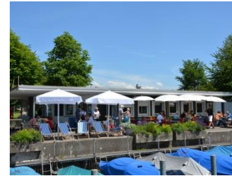
8610 am See