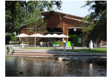
8610 im Stadtpark