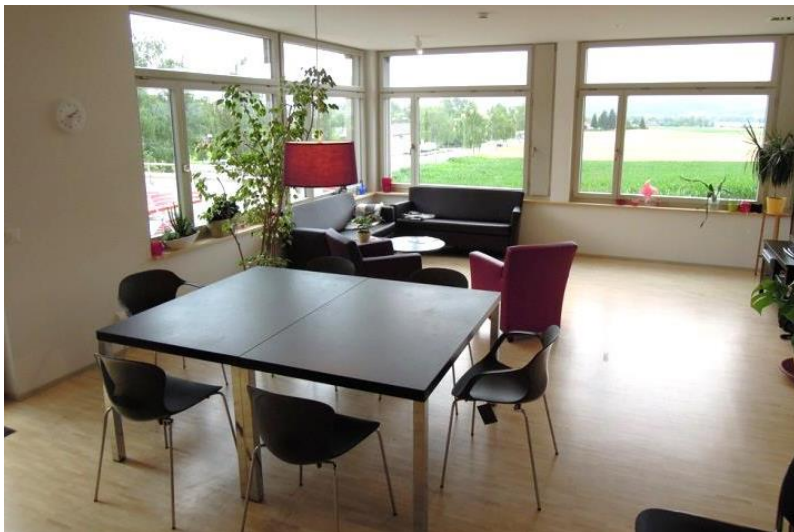
Wohn und Ess-Zimmer der Strukturwohngruppe